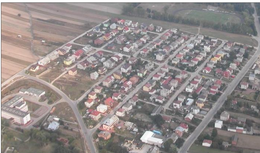
Fot.1 Osiedle nowoczesnych domów jednorodzinnych

Charakterystyczną formą zabudowy dla Lipska są domy indywidualne mieszkańców powstające od początku lat 90-tych XX wieku do dnia dzisiejszego. Największe skupisko w Lipsku tego typu, nowej zabudowy mieszkalnej to osiedle za szpitalem.